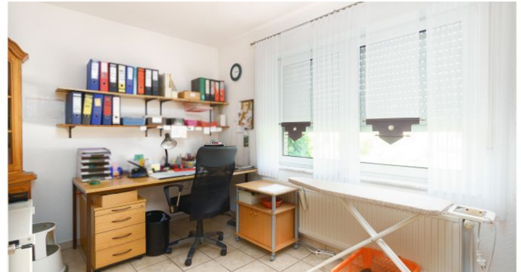
Schlafzimmer 2 EG