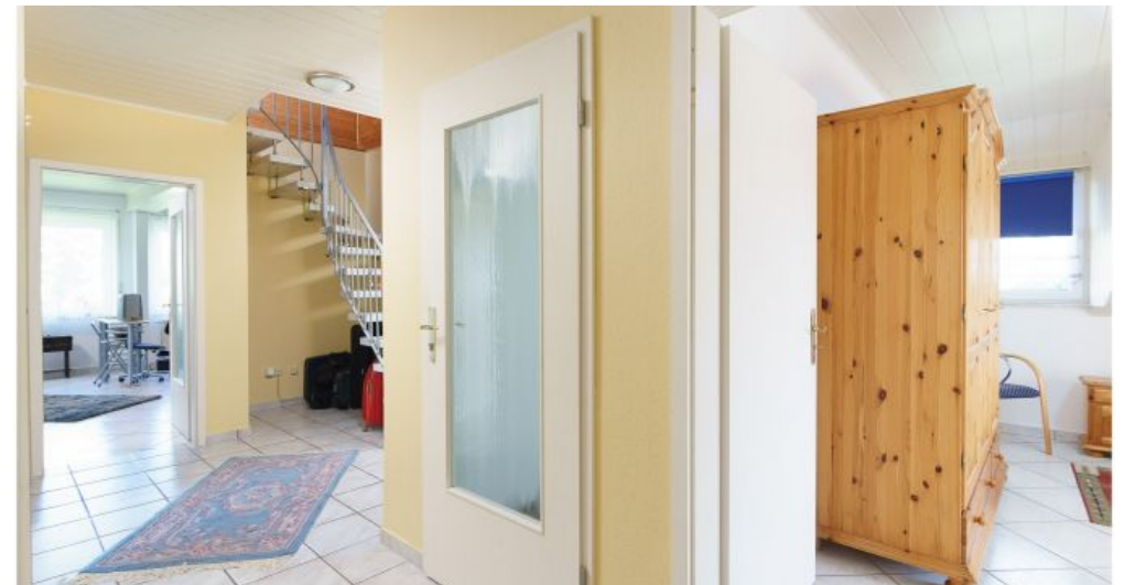
Eingangsbereich Flur OG