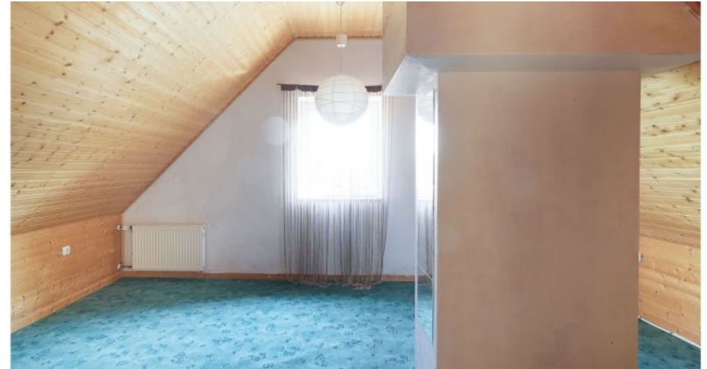
Dachgeschoss Zimmer 1