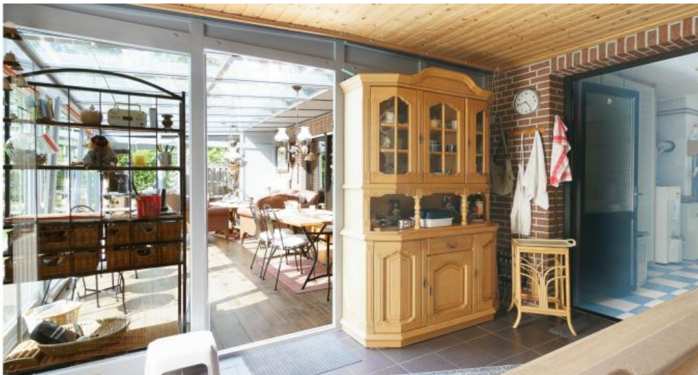
2. Küche EG