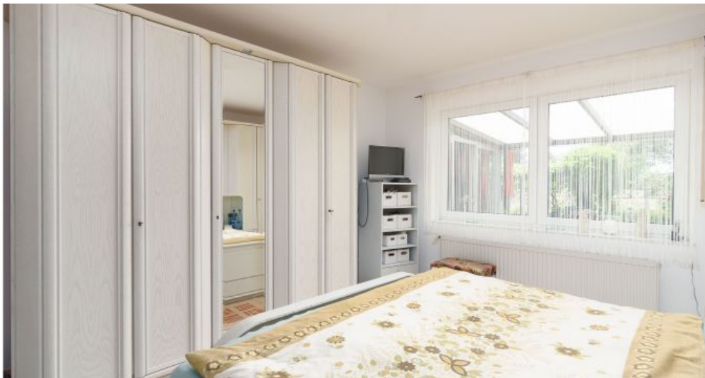
Schlafzimmer 1 EG