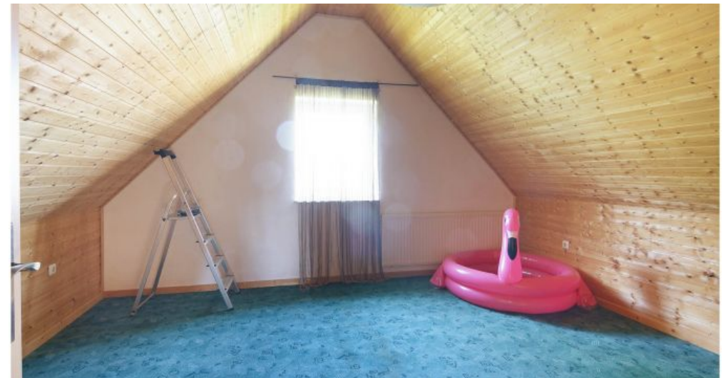
Dachgeschoss Zimmer 2