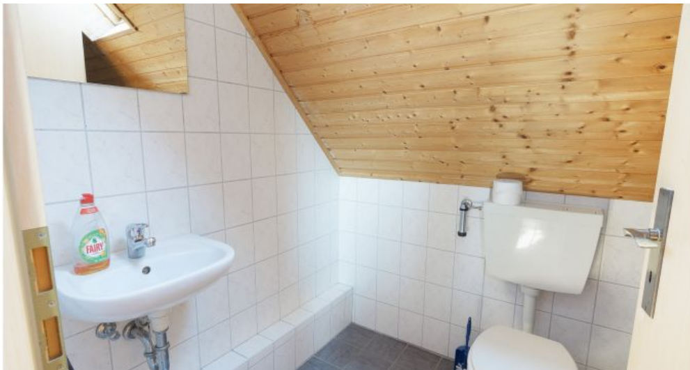
Dachgeschoss WC mit Dusche