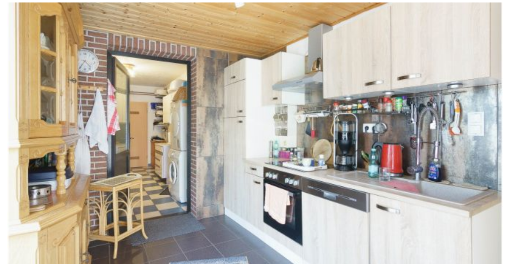
2. Küche EG