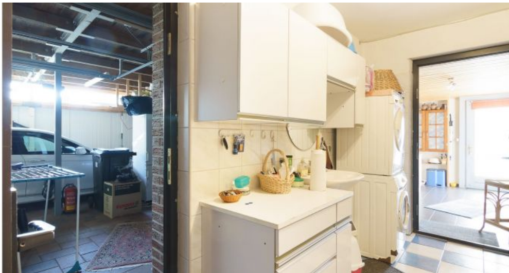
Hauswirtschaftsraum EG Garagenzugang