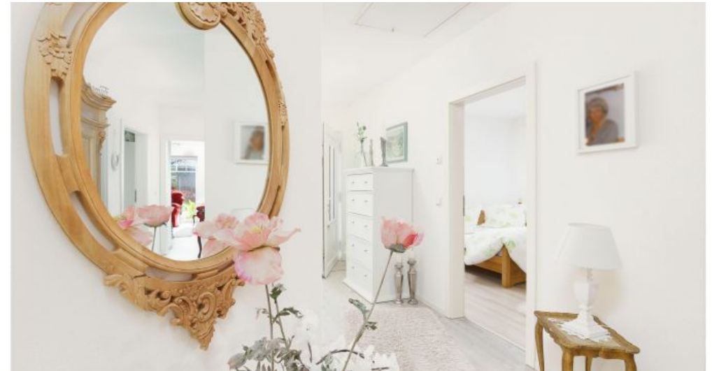
Flur - Blick in Schlafzimmer