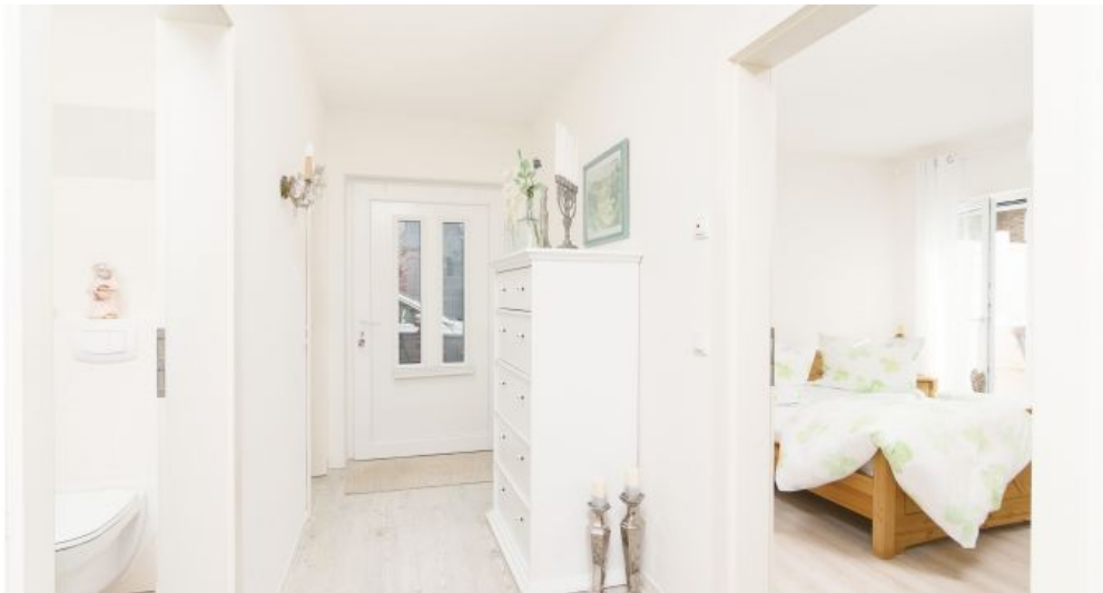
Flur - Blick in Schlafzimmer & Badezimmer