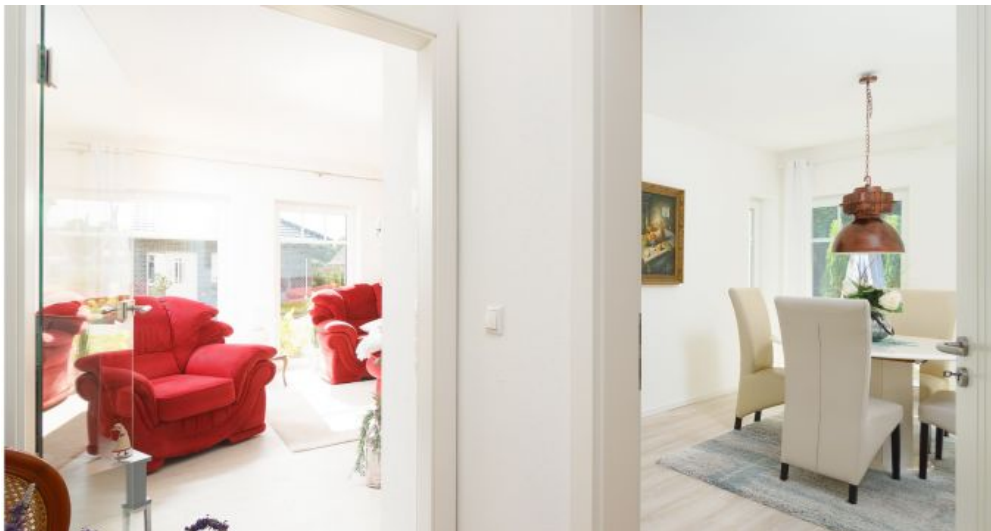
Flur - Sicht auf Wohnzimmer & Esszimmer