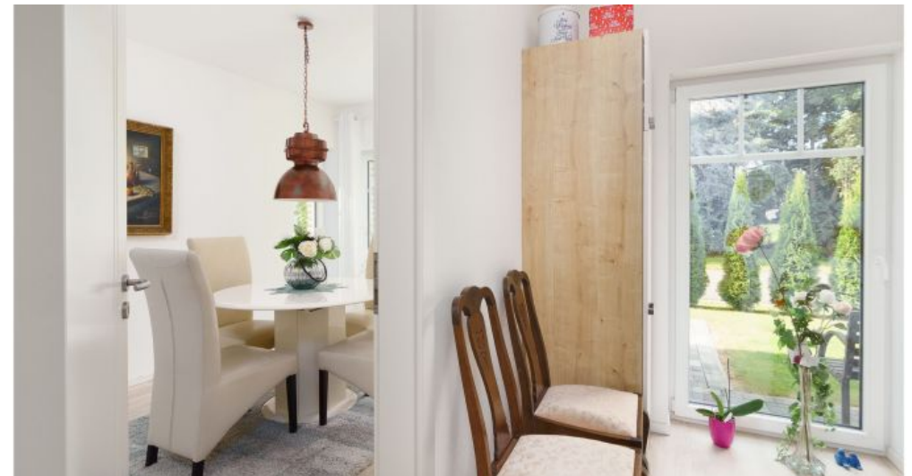
Küche - Blick in Esszimmer