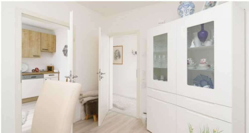
Esszimmer - Blick in Küche