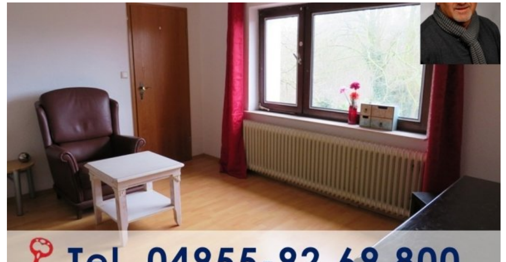
Titelbild internet vorlage(Vio